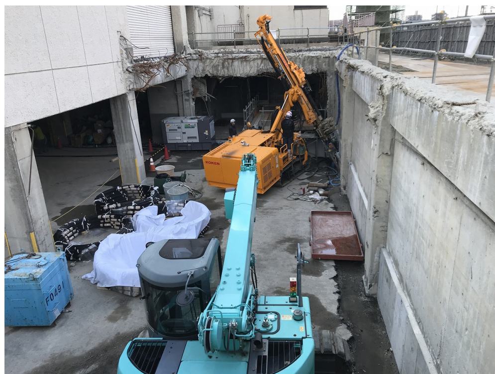
アースアンカー打設