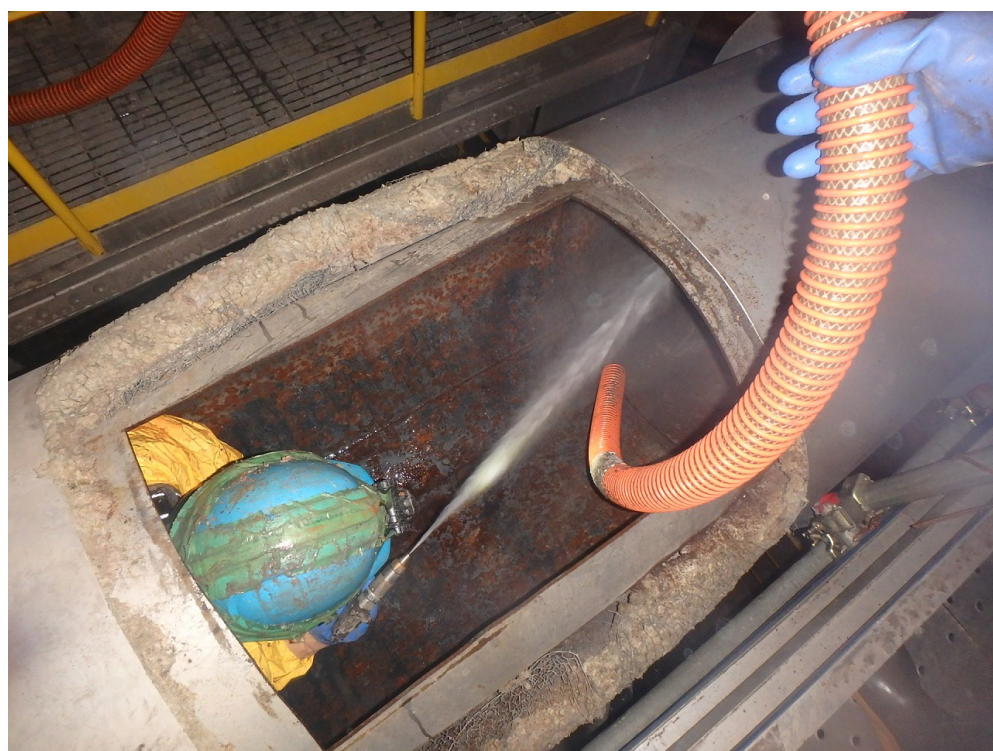
プラント機器除染状況