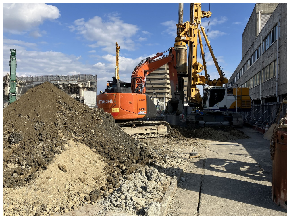
地中障害撤去（南面）