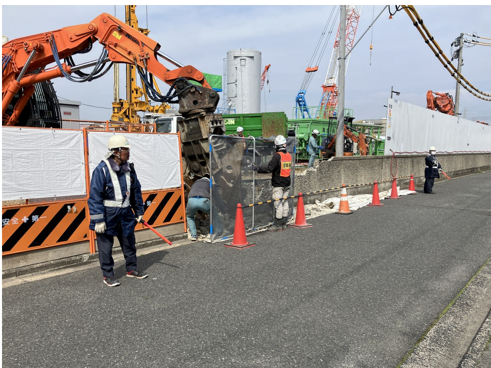
外構解体（植栽立上り）