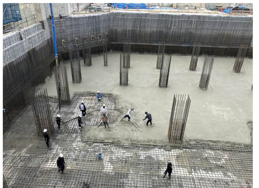
耐圧盤最下層 CON打設