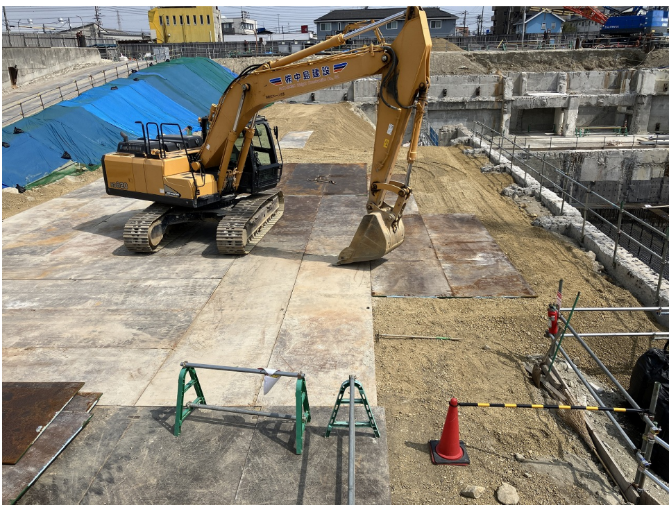
プラットフォーム整形