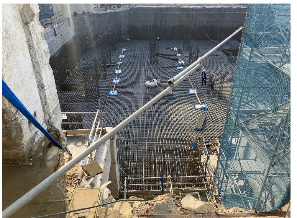
炉室耐圧盤 上筋配筋