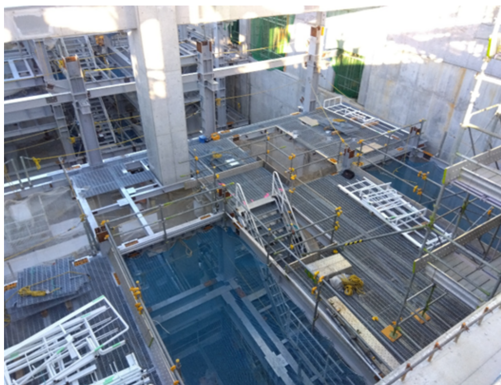
排ガスエリア鉄骨1節建方