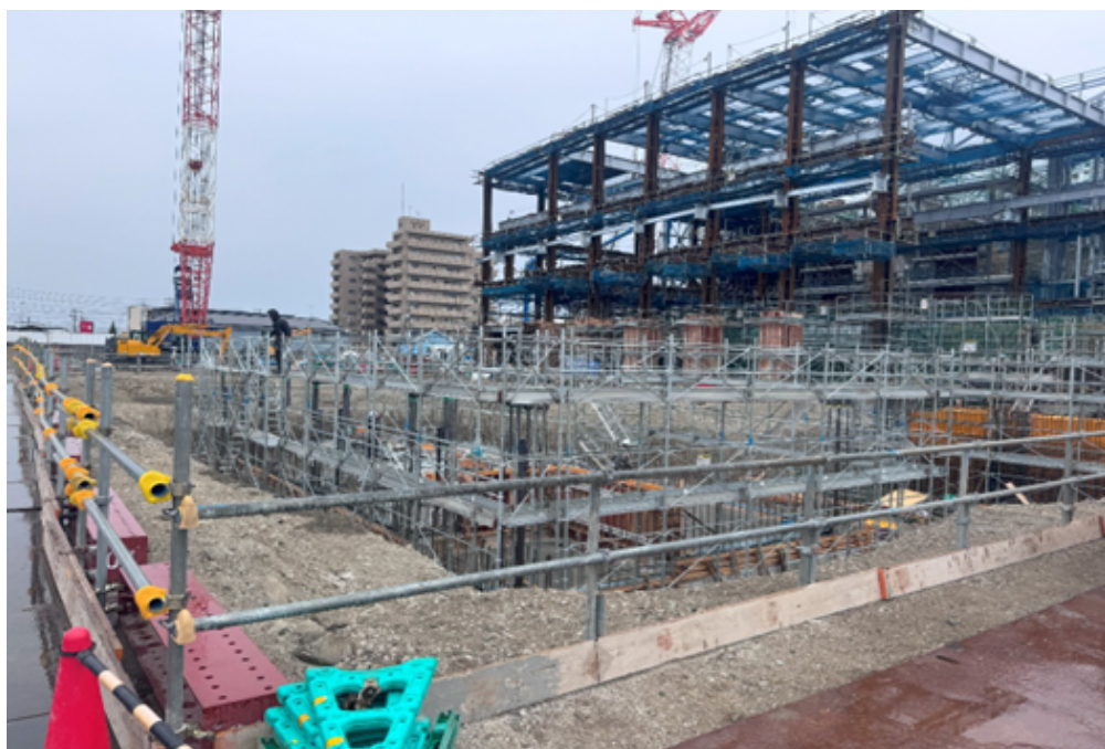
北側地下躯体施工状況