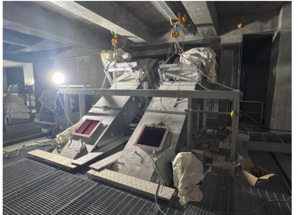
焼却灰搬送コンベヤヘッド部組立