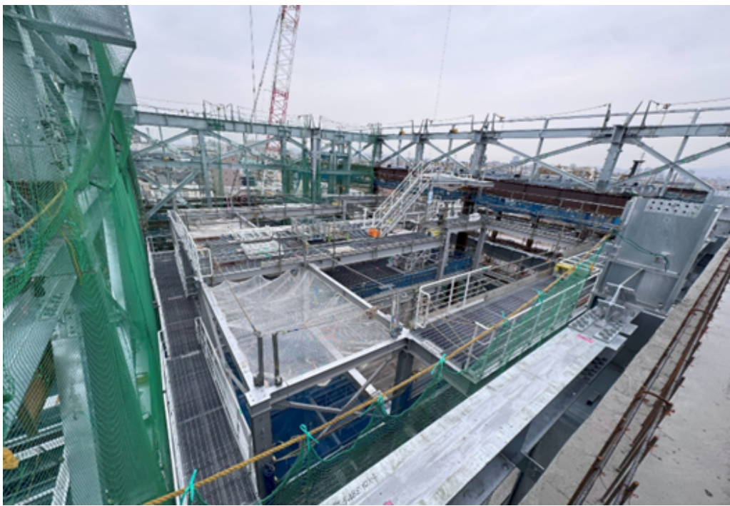
プラント鉄骨全景