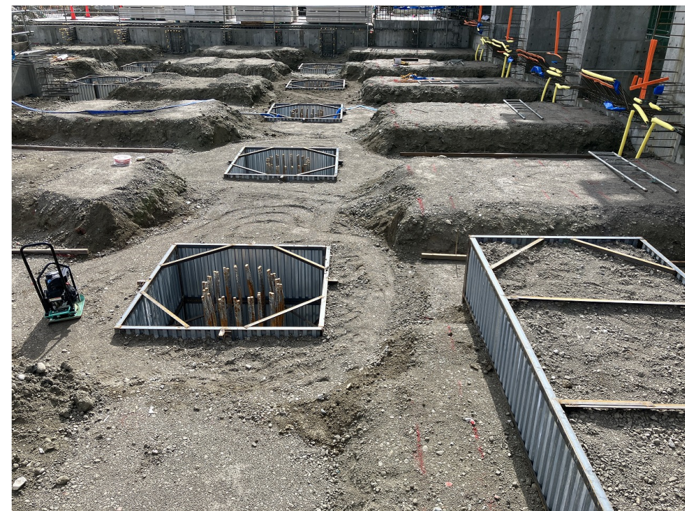
プラットフォーム掘削