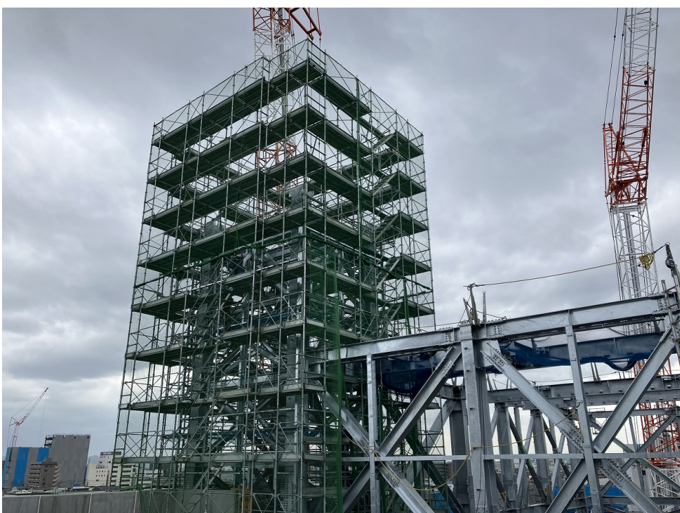
煙突鉄骨建方状況