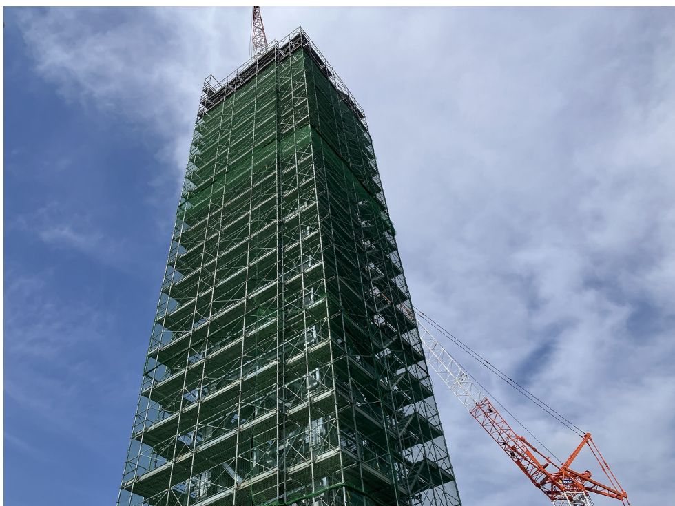
煙突鉄骨建方完了