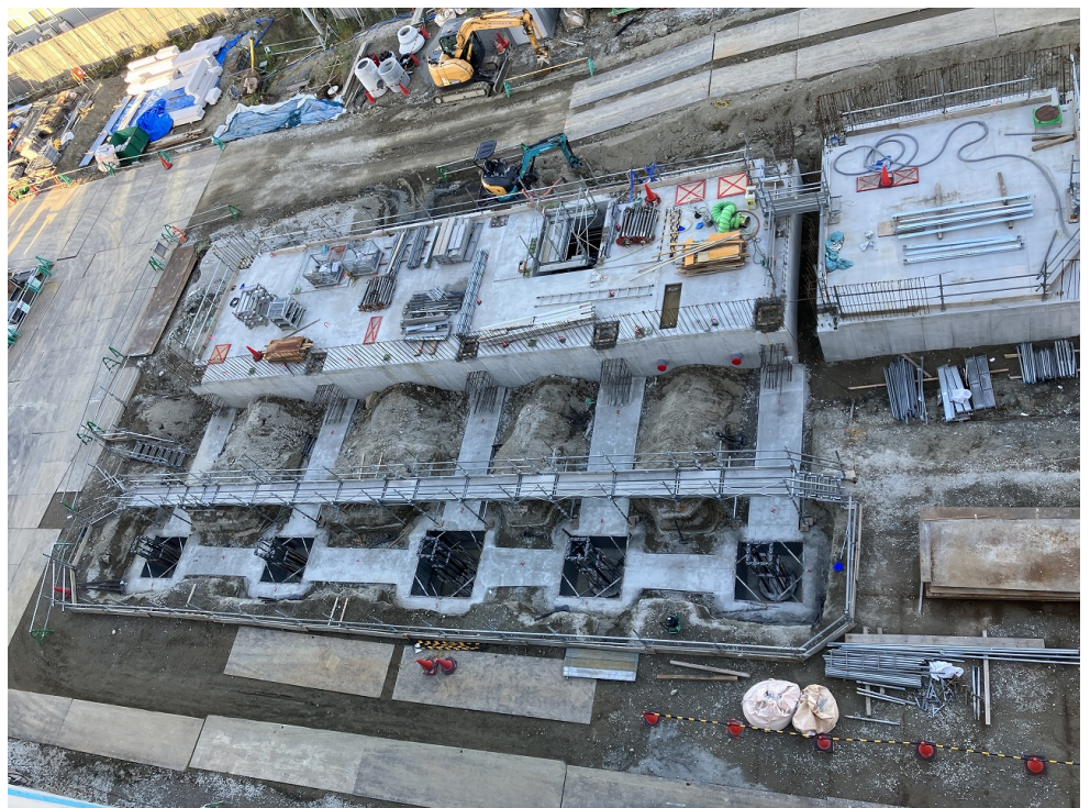
管理棟 掘削・捨てコン