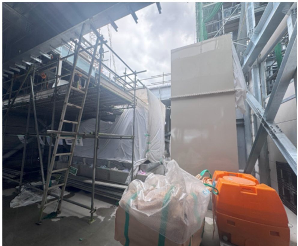
ボイラエリア全般