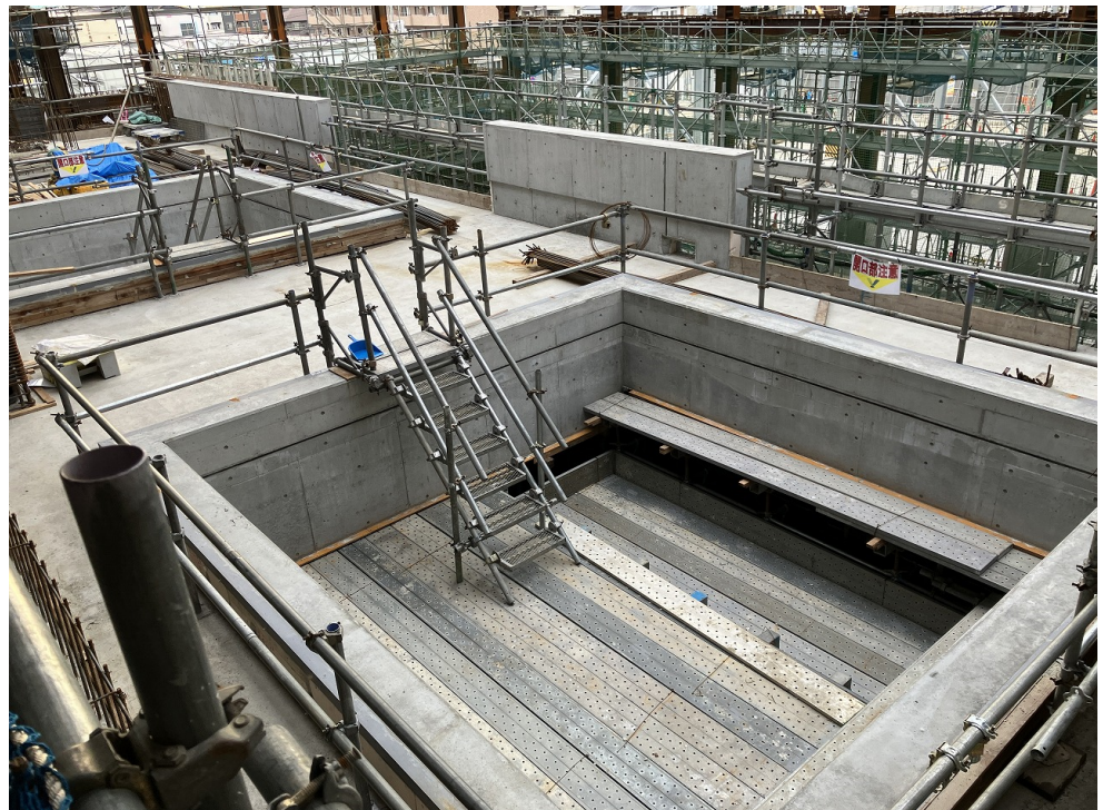
ホッパーステージCON打設後